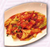
▲トッポッキアラビアータイメージ

6月1日(水)~6月30日(木)まで全国20店舗のトラベルカフェにて「みんコリ Cafe」がオープンされる。韓国観光広報物の配布、パネル展示を実施中。主要5店舗(六本木、池袋、名古屋インターシティ、大阪阪急三番街、福岡天神店)では、上記に加えトッポッキアラビアータなどのオリジナルCafeメニューを展開。また、六本木店ではInterFM「Refill Korea!」の公開ラジオ収録等のイベントを予定。詳細はトラベルカフェ HP まで： http://www.travel-cafe.jp/