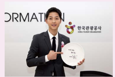
▲開館式(4.11)に訪れた韓国観光名誉広報大使のソンジュンギ(「太陽の末裔」主人公)