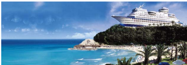
▲江陵 サンクルーズリゾート

江原道内3地域(平昌郡、旌善郡、江陵市)にまたがり開催される「2018年平昌冬季五輪」。北海道や長野の軽井沢のように、この地域は五輪招致以前からスキーや海水浴客でにぎわう韓国有数のリゾート・観光地でもあり、レジャー施設を備え、敷地内にホテルやコンドミニアムなどタイプ別の宿泊棟を持つ大型複合リゾートが多いのが特徴。平昌・旌善は広々とした高原で楽しむスキーやゴルフ、江陵はオーシャンビューが魅力だ。各エリアの代表的な宿泊地を紹介する。