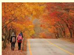
▲内蔵山 秋イメージ

全羅北道FaceBook : https://www.facebook.com/jeonbuk.kr