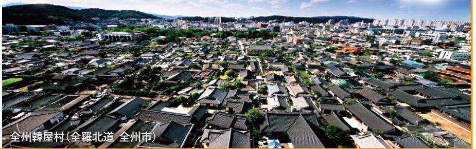
全州韓屋村(全羅北道 全州市)