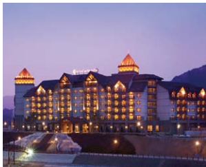
▲平昌 アルペンシアリゾート