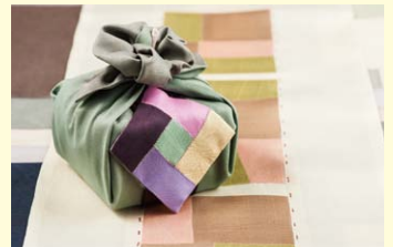
▲ポジャギイメージ